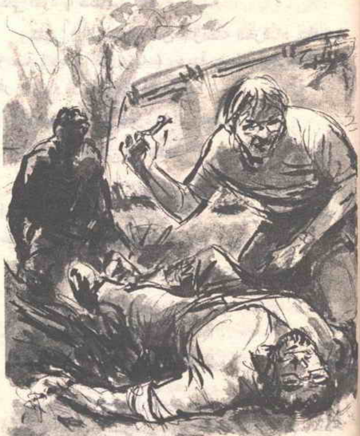
أخيراً رأيته يرفع يده بالجفت ، ورأيت المقذوف المعدنى الملوث بالدم بين فكى الجفت ..