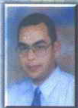
د. احمد خالد توفيق

هكذا كان يقف ، تلتمع صلعته في ضوء الشمس ، يلوح بالبندقية في يده اليمنى .. وكما اعتاد دوماً طوح بذقنه للوراء وصدره للأمام مقلداً (موسولينى) .. بدا لنا في وقفته عكس الشمس اسطورياً .. الموت نفسه وقد غادر كتب الأساطير القديمة ووقف ها هنا ينتظرنا . ولن نقرّ منه مهما حاولنا .