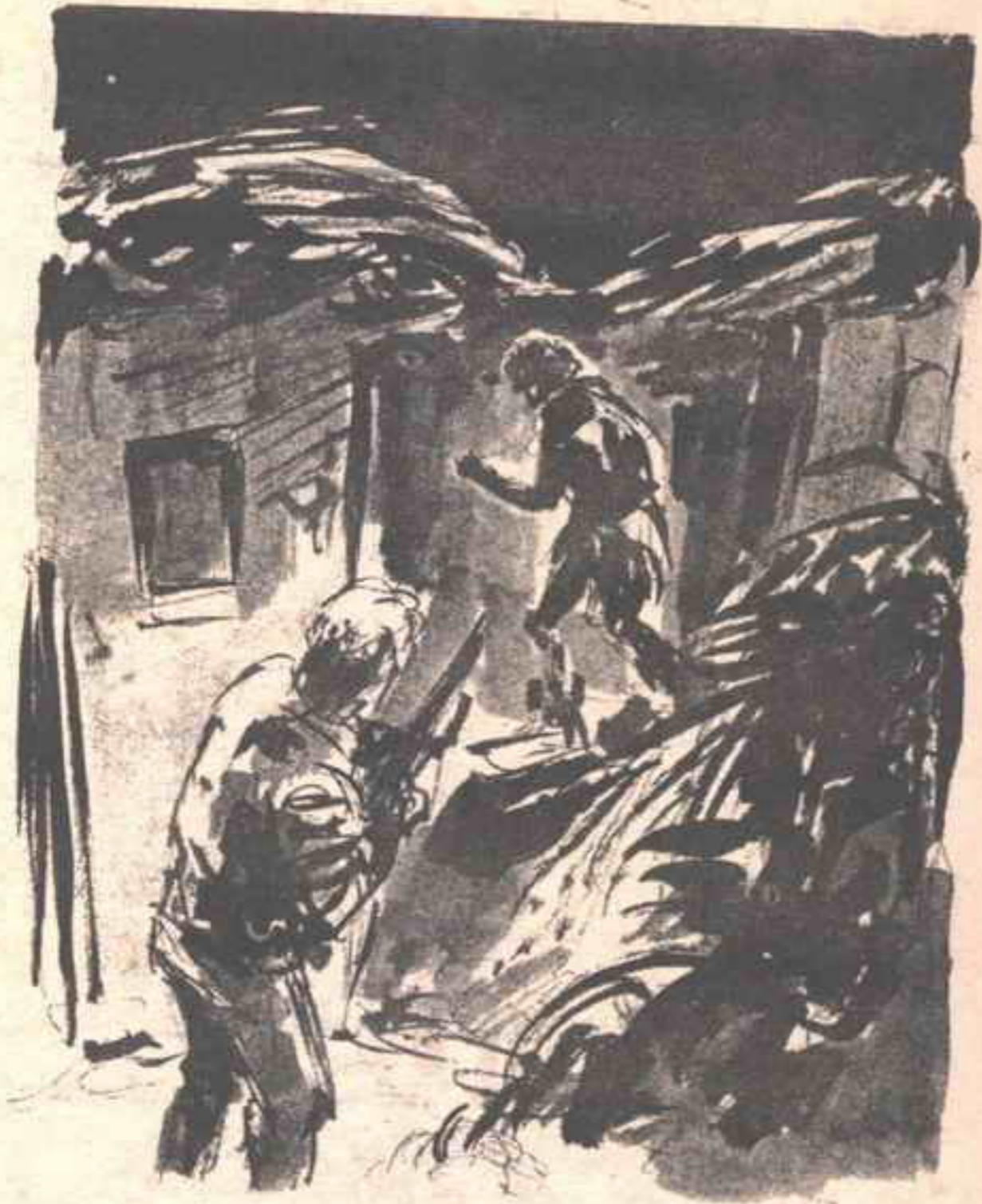
كان يخرج من وراء كوخ طينى ليدخل وراء كوخ آخر ، بتلك الخطوات الغريبة المتمهلة غير العجول ..

تملاً الدنيا عويلاً لدى أول خطر ، والأدهى أن يتضح أنه ليس خطراً ..